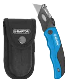
Klappmesserset inklusive 5 Ersatzklingen ART.-NR. 709286 // Zuschneiden des Trägerfilz