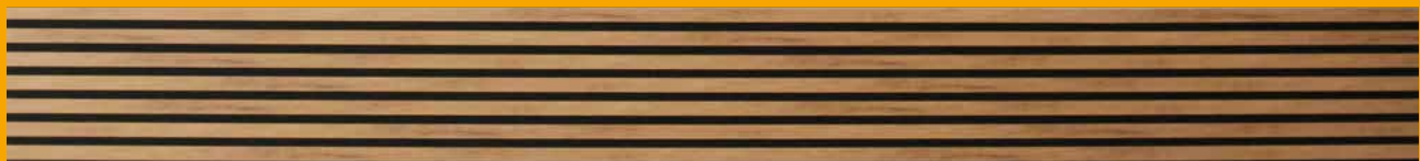
Bronze Oak, ART.-NR. 1383446