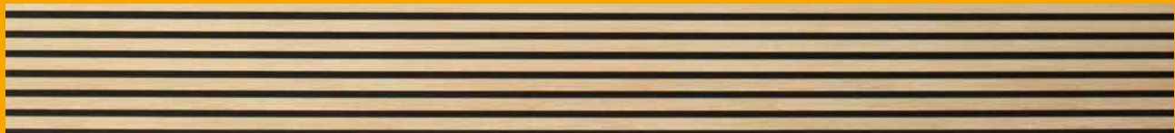
Natural Oak, ART.-NR. 1383444