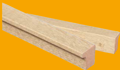
Natural Oak, Format: 260×2,2×1,8 cm ART.-NR. 1383447