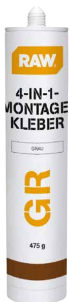
RAW Montagekleber 4 in 1 ART.-NR. 1040595 // Ankleben der Akustikpaneele an Wand