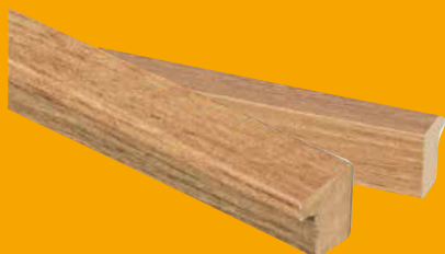
Bronze Oak, Format: 260×2,2×1,8 cm ART.-NR. 1384049