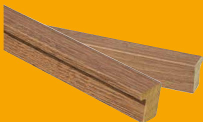
Rustic Oak, Format: 260×2,2×1,8 cm ART.-NR. 1384048