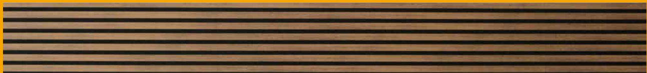
Rustic Oak, ART.-NR. 1383445